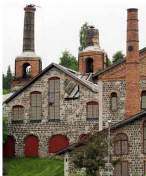
Bevarad bruksmiljö vid Iggesund.